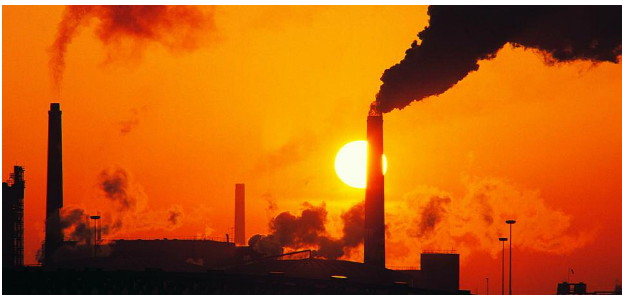
W 2006 roku wyemitowano w Polsce ok. 9 ton CO 2 na osobę.

Koncentracja wyżej wymienionych gazów w atmosferze zwiększyła się gwałtownie od czasów intensywnego rozwoju przemysłu. Wzrost ten był szczególnie duży w drugiej połowie XX w. Średnia koncentracja dwutlenku węgla w atmosferze, którą oceniano w erze przedindustrialnej na około 280 ppm 1 , zwiększyła się w roku 2005 do 379 ppm. Tempo wzrostu koncentracji tego gazu w latach 1995–2005 szacuje się na 1,9 ppm na rok. Globalne stężenie metanu wzrosło od ery przedindustrialnej do roku 2005 z 715 ppb 2 aż