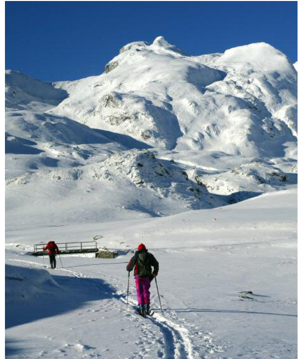
Z roku na rok dni sprzyjających białemu szaleństwu może być coraz mniej.

Wzrost temperatury powietrza jest już wyraźnie zauważalny w naszym kraju w okresie zimowym i oznacza coraz mniejszą liczbę dni, w których temperatura powietrza spada poniżej zera oraz spadek liczby dni z opadem śniegu i pokrywą śnieżną. Skutkiem tego zjawiska będzie skrócenie zimowego okresu wypoczynkowego w górach, a w związku z tym – spadek dochodów społeczności utrzymujących się z turystyki i sportów zimowych. Mimo że wzrost temperatury powietrza w okresie letnim jest mniej zauważalny,